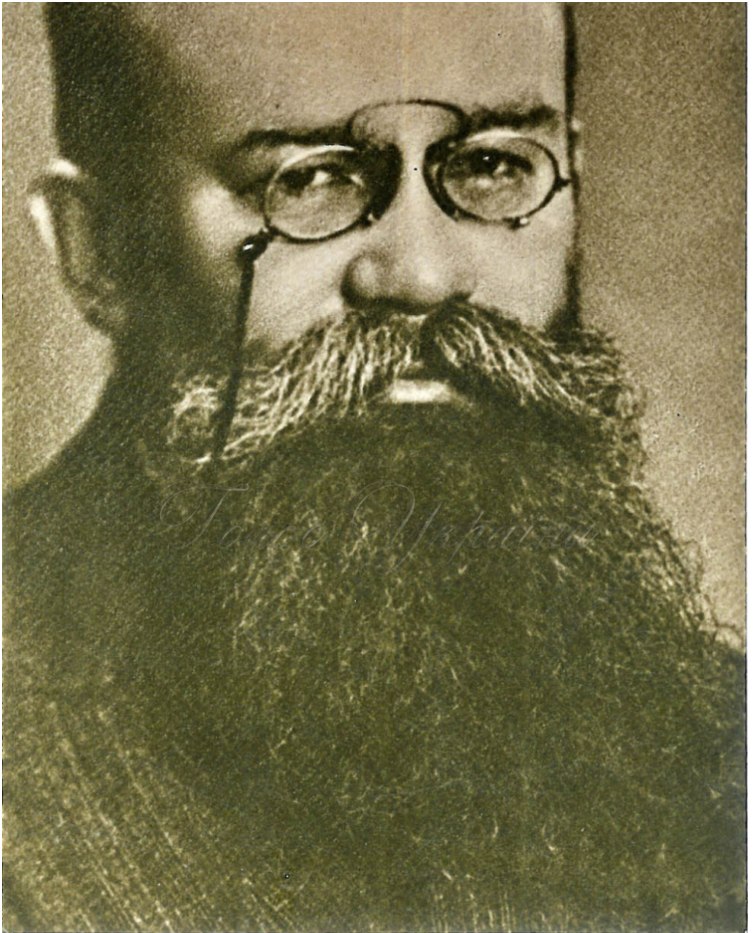
Поштова листівка з фотографією М. Грушевського, датована 1917 р.