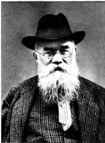
М. С. Грушевский.

ему разрешили переезд в Казань, затем в Москву. В марте 1917 — апр. 1918 пред. Центр. рады в Киеве. С 1919 в эмиграции. В 1919 основал в Вене Укр. социологич. ин-т. С 1924 в СССР.