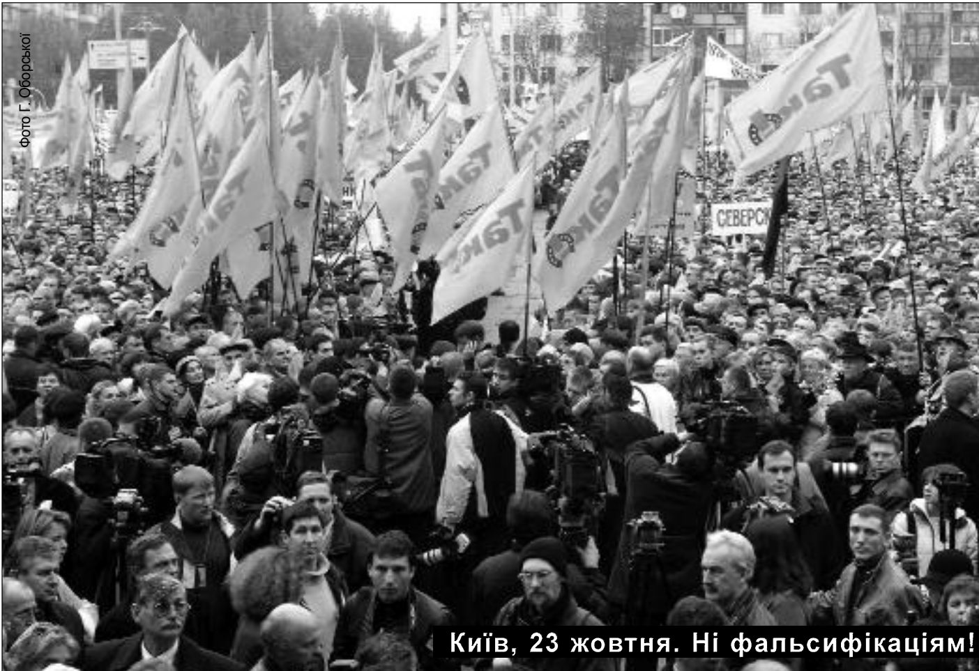
Київ, 23 жовтня. Ні фальсифікаціям!

ТИЖНЕВИК ВСЕУКРАЇНСЬКОГО ТОВАРИСТВА «ПРОСВІТА» імені ТАРАСА ШЕВЧЕНКА