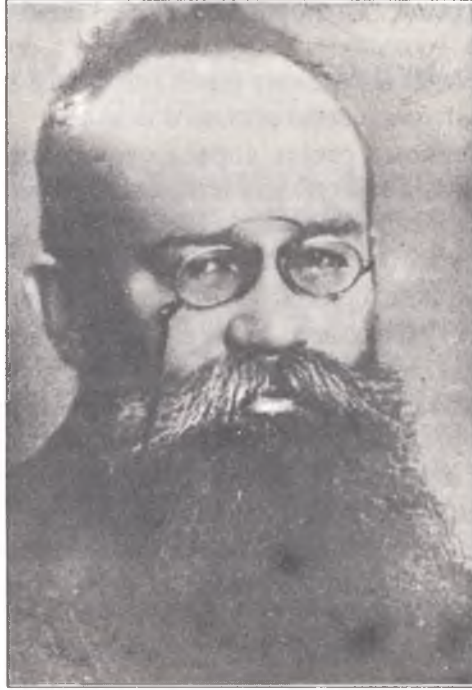
М. С. Грушевський. 1910-і рр.

культури, громадського руху тощо. Мабуть, і зараз доцільно подумати у цьому зв'язку про створення при Інституті археографії центру по виданню епістолярної спадщини М. Грушевського. Необхідною є координація