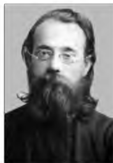
М. Ф. Грушевський.