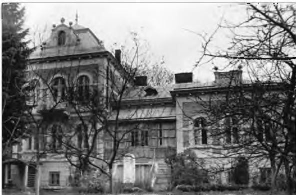
Будинок державного меморіального музею М. Грушевського у Львові.

ГРУШЕВСЬКОМУ МИХАЙЛОВІ ПАМ'ЯТНИКИ. 1) Надгробний пам'ятник на Байковому