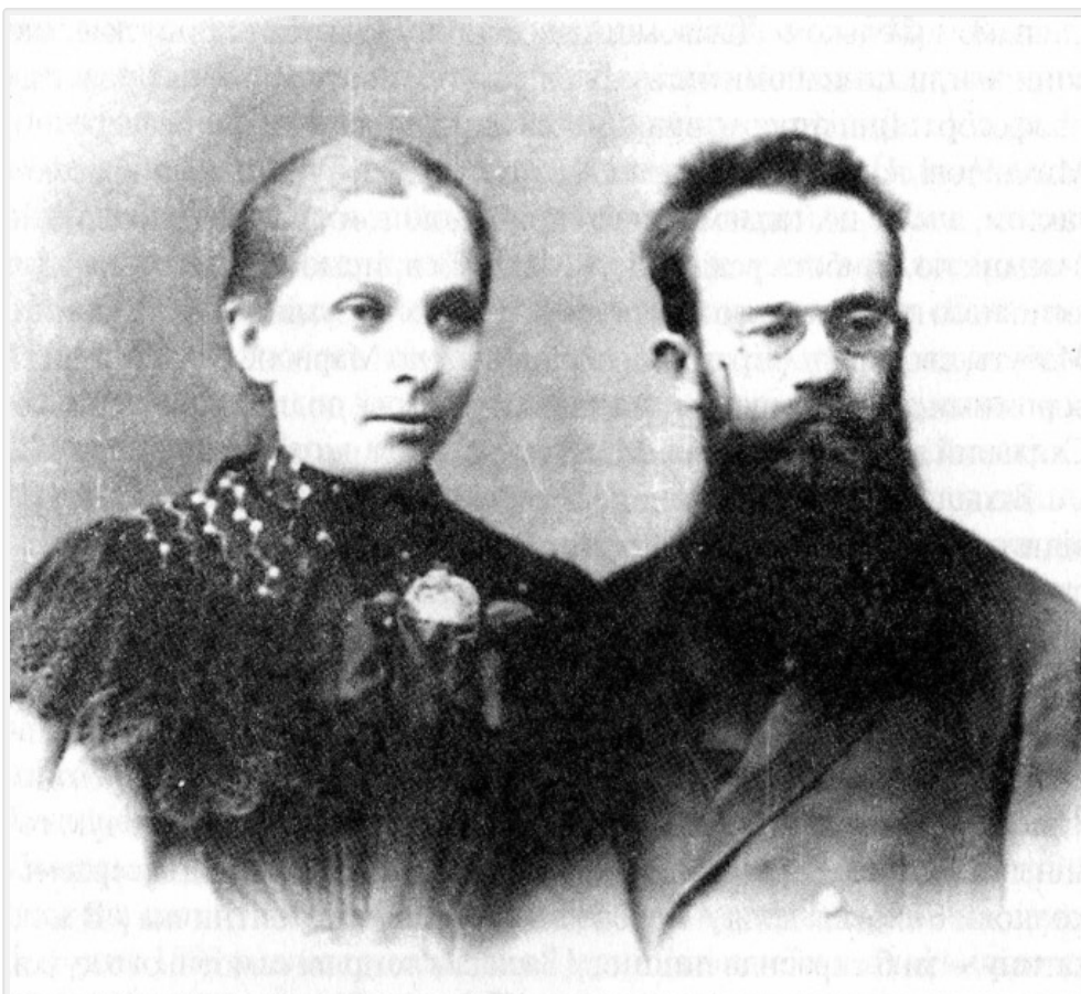
Михаил Грушевский с женой, конец 1890-х годов

В начале августа 1899 года галицкие делегаты во главе с Грушевским публично хлопнули дверью — отказались участвовать в работе очередного археологического съезда в Киеве, где им запретили публично выступать на своем языке. Ведь до 1905 года в южных губерниях даже Библия не могла быть напечатана на украинском языке, а многие галицкие издания запрещены к распространению вовсе не из-за крамольного содержания. Ситуация изменилась с Первой русской революцией — когда Грушевский перенес в Киев издание журнала «Литературно-научный вестник» и основал Украинское научное общество, тесно связанное с галицким Научным обществом имени Шевченко. Это далеко не всем понравилось во Львове, да и в Киеве отношение к Грушевскому было уважительным, но далеким от безусловного поклонения.