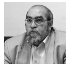
Гефтеровские дискуссии с историком Константином Морозовым