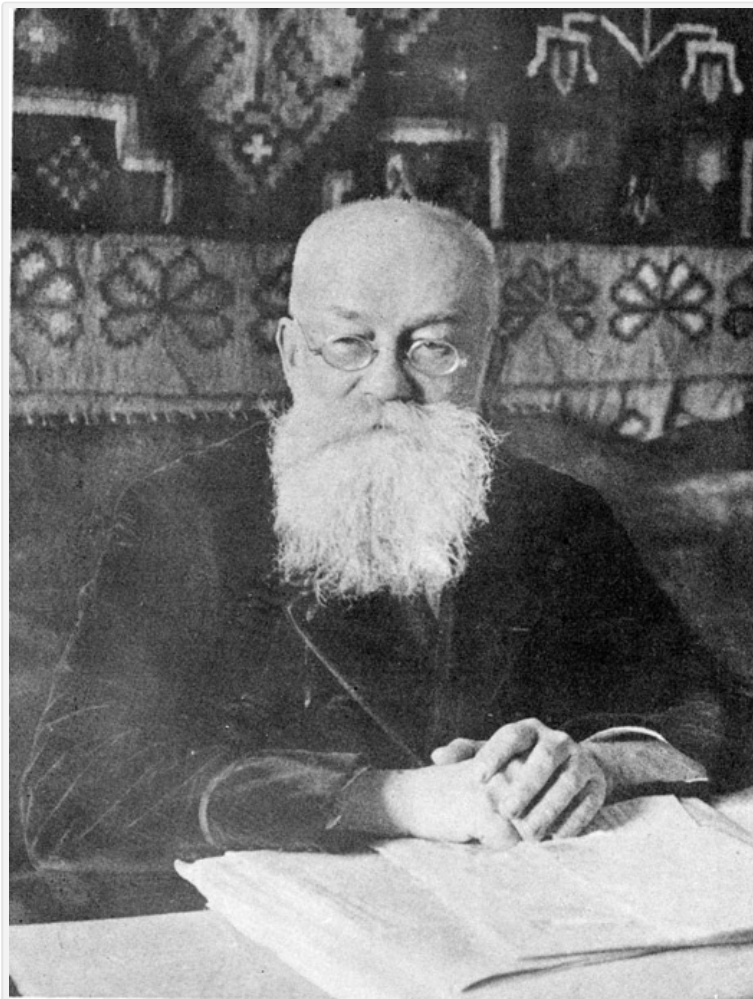
М.С. Грушевский в своем кабинете (конец 1920-х годов)

Летом 1930 года началась чистка его кафедры сотрудниками Рабоче-крестьянской инспекции; 30 августа Грушевский отправляет из Кислородска в Киев развернутое письмо, оспаривающее выводы комиссии по чистке [66] (куда были включены рабочие киевских заводов), — но реального значения его действия уже не имели. По постановлению Совнаркома от 1 августа 1930 года и на основании решения подразделения украинского Наркомпроса от 31 августа кафедра Грушевского с 15 сентября объявлялась ликвидированной [67]. Его главное организационное творение 1920-х перестало существовать, сам он превратился в объект проработки уже не на страницах партийной печати, а внутри Академии.