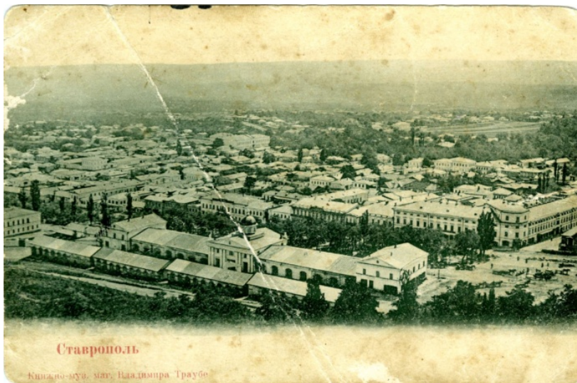
↖ Панорама Ставрополя з Гостиним рядом (вид з дзвіниці Казанського собору) Початок XX ст. Поштова картка з колекції Ставропольського державного музею-заповідника