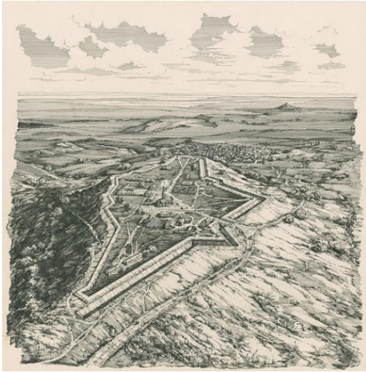
↖ Ставропольська фортеця з висоти пташиного польоту Кінець XVIII ст. З колекції Ставропольського державного музею-заповідника

Основою міста стала збудована на високому Кріпосному пагорбі потужна фортеця, біля якої виникли козацька станиця, солдатська слобода, а потім інші осередки життя. У 1822 р. Ставрополь став центром Кавказької області, а 1847-го – Ставропольської губернії. Грушевські з'явилися там усього через кілька років після закінчення півстолітньої Кавказької війни, і все навколо пам'ятало героїчну боротьбу кавказьких горців.