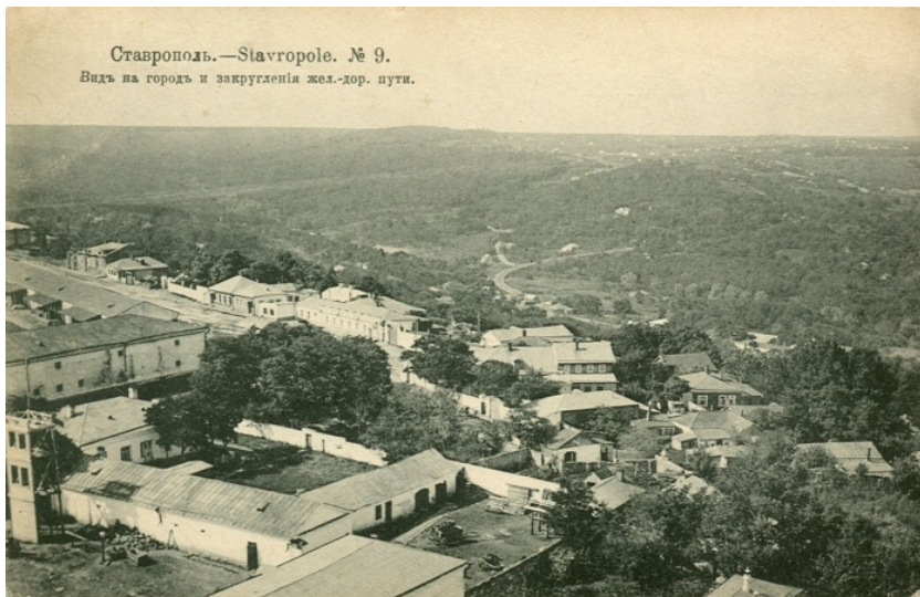
↖ Панорама Ставрополя кінця XIX–початку XX ст. Вид з дзвіниці Казанського собору