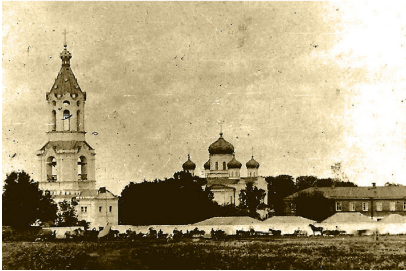
↖ Ставрополь. Иоанно-Мар'їнський жіночий монастир з собором Івана Предтечі Кінець XIX–початок XX ст. Поштова картка з колекції Ставропольського державного музею-заповідника