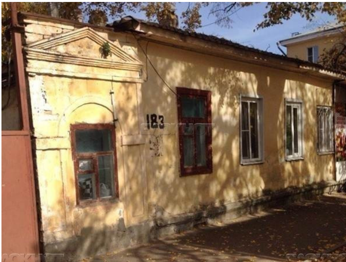
↗ Ставрополь. Будинок 1830-х рр. – єдиний на колишній Воробйовці, що зберігся з часів Грушевських до наших днів

Відомо, що в Ставрополі родина Грушевських за вісім років змінила три помешкання. Певно, спочатку статки молодого інспектора були дуже скромними. Тому першою їхньою адресою стала занедбана садиба купця Носова в далекім передмісті Воробйовка[5], що залишила в малого Михайла враження «чогось темного і понурого». У 1870-х рр. там були вулиці Перша Воробйовська (тепер Ф. Дзержинського) і Друга Воробйовська (тепер М. Морозова) з поперечними провулками. Точніше назвати адресу першого ставропольського помешкання вже, мабуть, не пощастить, та й зберігся від тих часів на колишній Воробйовці лише один будинок. У ньому зупинявся колись М. Лермонтов і, поза сумнівом, півтора століття тому цей дім бачили Грушевські.