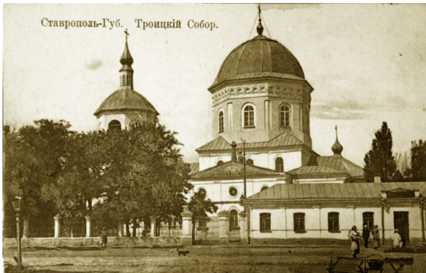
↗ Троїцький кафедральний собор (у М. Грушевського – «Старий собор»)