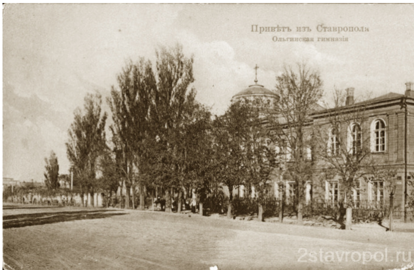
↗ Ставрополь. Будівля Ольгинської гімназії