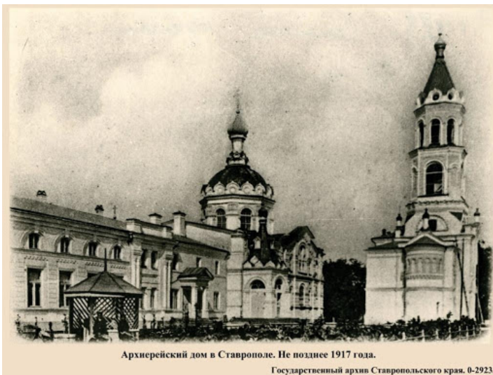
Архієрейський дом в Ставрополі. Не пізніше 1917 года.