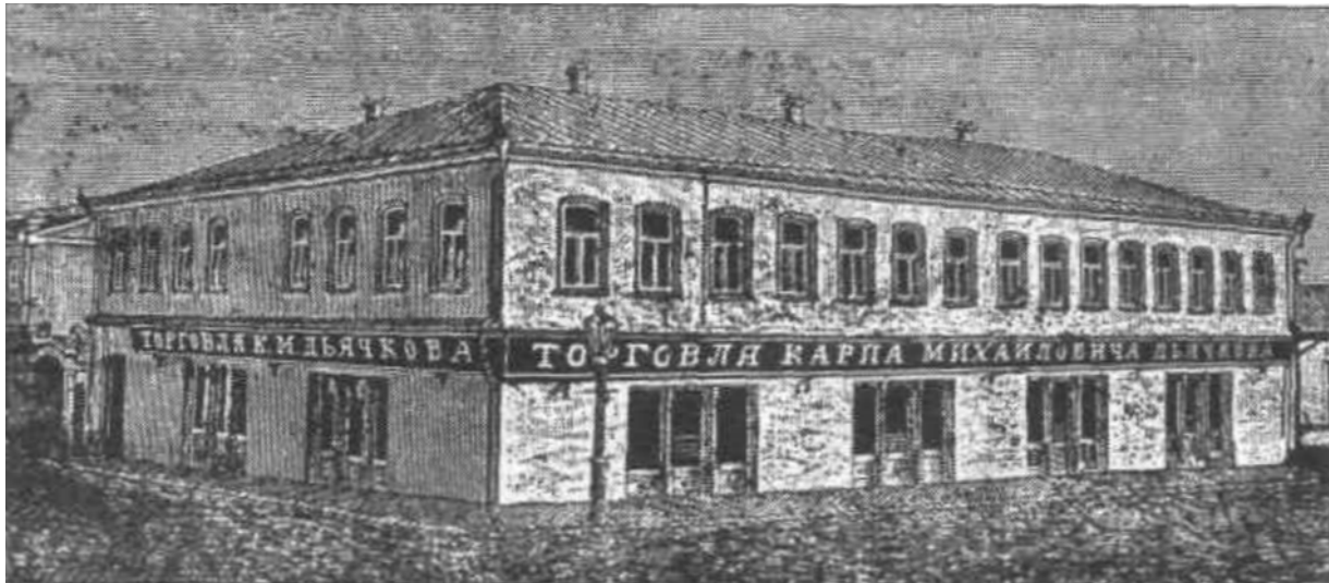
↗ Будинок Дячкова, де в 1872–1878 рр. мешкала родина Грушевських Ставрополь, вулиця Вірменська (тепер Шаумяна, 18). Початок XX ст.

Отже, приблизну локалізацію дому Дячкова подає сам Михайло Грушевський. Та чи можна точніше? Наполеглива співпраця з науковцями Ставрополя дозволяє назвати навіть його точну адресу: вулиця Шаумяна (колишня Вірменська), 18. Будинок зберігся! Його тепер займають мирові судді Ставропольського краю.