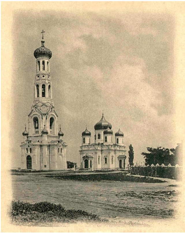
↗ Казанський собор у Ставрополі Кінець XIX–початок XX ст. Поштова картка з колекції Ставропольського державного музею-заповідника

Дзвіницю освячували 1873 р. –вже за Грушевських, і вони могли бути присутніми на цій події. Її оригінальний чотиририбусний силует висотою 98 м (для порівняння: Велика дзвіниця Києво-Печерської лаври – 96,5 м) відразу став головною домінантою Ставрополя. Хоч сам Казанський собор з'явився раніше (1847 р.), але й він для Михайла Сергійовича був «новим собором».