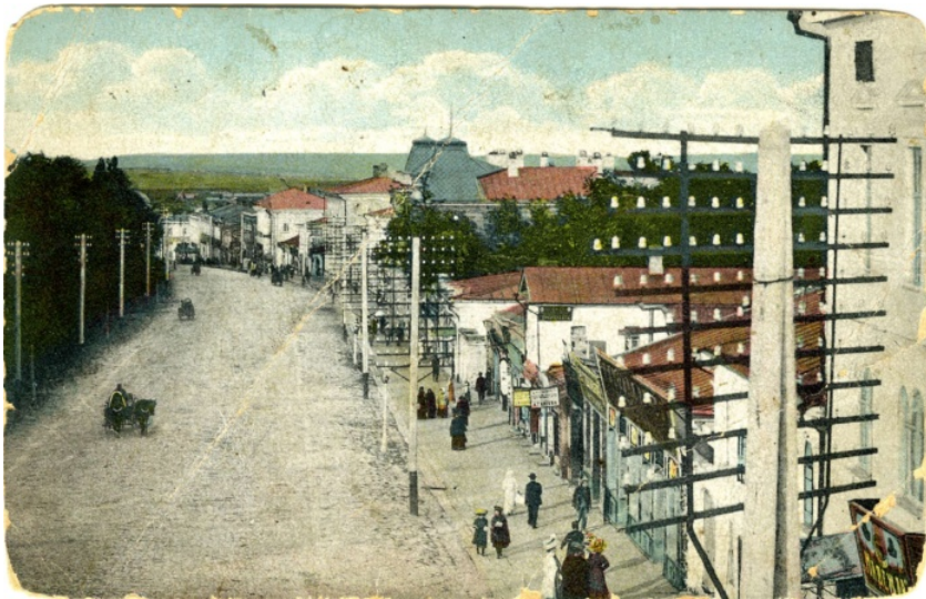
↑ Ставрополь. «Николаевский проспект» («Большой проспект», за «Споминами» М. Грушевського – «Большая улица»), на який виходила вулиця Вірменська з домом, де мешкали Грушевські. На цей проспект батьки виводили на прогулянки малого Михайла. Початок ХХ ст. Поштова картка з колекції Ставропольського державного музею-заповідника

Дім Дячкова був у самому центрі міста. Зі «Споминів» знаємо, що з вікон їхньої великої зали відкривався вид на гостині ряди і собор, що їхня вулиця (на той час вона звалась Вірменською, тепер – вулиця Шаумяна) з одного боку виходила на «Нижній базар», а з іншого – на «Большую улицу» з бульваром акацій посередині. Тепер, через півтора століття, впізнати ці місця здавалось майже неможливою справою, тим більше, що сам вчений признавався, що не знав точно справжніх назв цих вулиць. Але після консультацій з ставропольськими науковцями стало зрозуміло, що «Большая улица» з бульваром акацій – це насправді «Большой проспект», який багато разів змінював назву, зокрема на дореволюційних листівках він відомий як «Николаевский проспект», а нині це проспект Карла Маркса – головна магістраль Ставрополя.