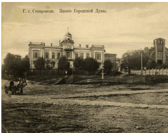
↗ Ставрополь. Будинок Міської думи Кінець XIX–початок XX ст. Поштова картка

Казанський собор запам'ятався вченому ще й тому, що Кріпосна гора, на якій він стояв, стала місцем, куди його малого з ще меншою сестричкою водили в «примусову гулянку». Їхній шлях до собору пролягав довгими і широкими масивними кам'яними сходами «Парадної (Красной, Соборной) лестниці» від площі на «Большой улице», де стояла Міська дума[14].