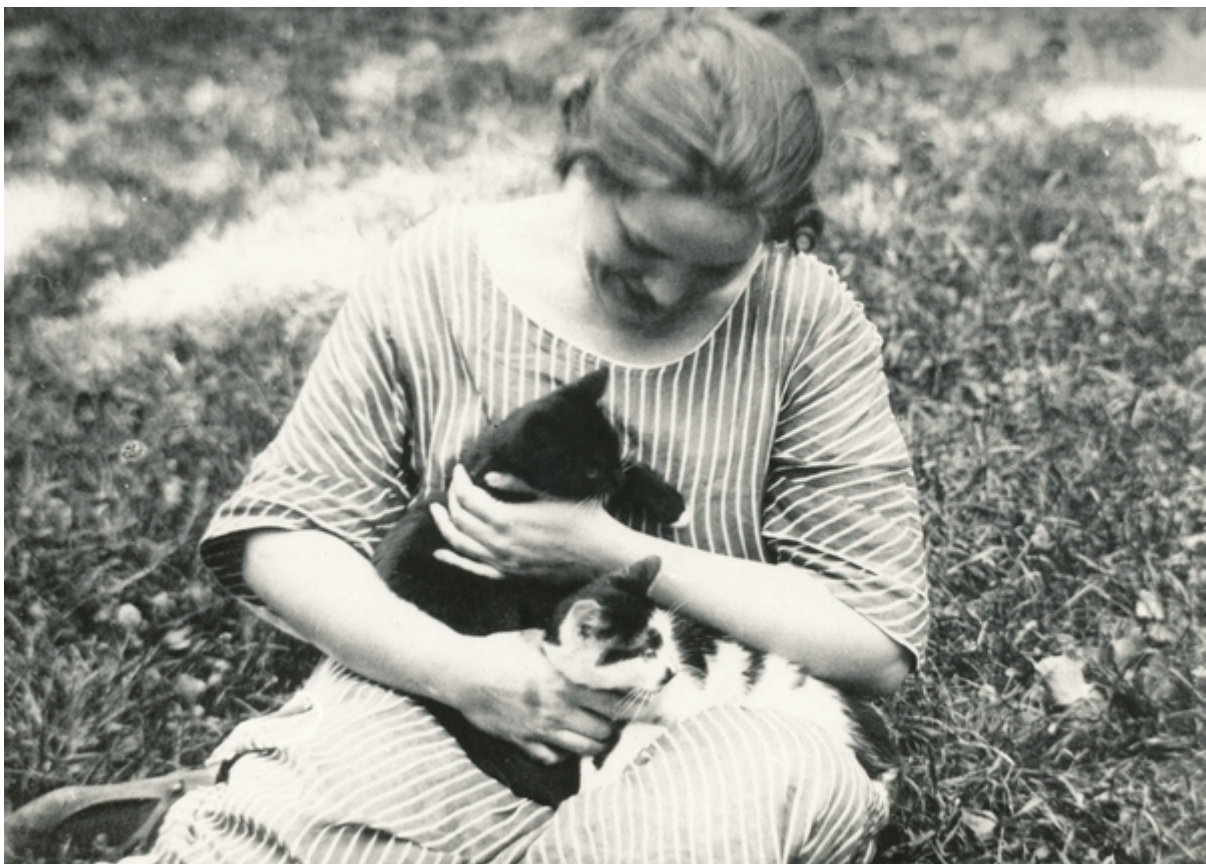
На київській садибі

Найдорожченько, я часто думаю в сі дні, як я собі крутив голову в Бадені і потім, приїхавши до Київа – як тобі улекшить твою наукову путь і забезпечити можливе становище, і як ти зробила зайвими і непотрібними всі мої клопоти і замисли, так прегарно себе заявивши в сих роках і по лінії дослідчій і організаційній".