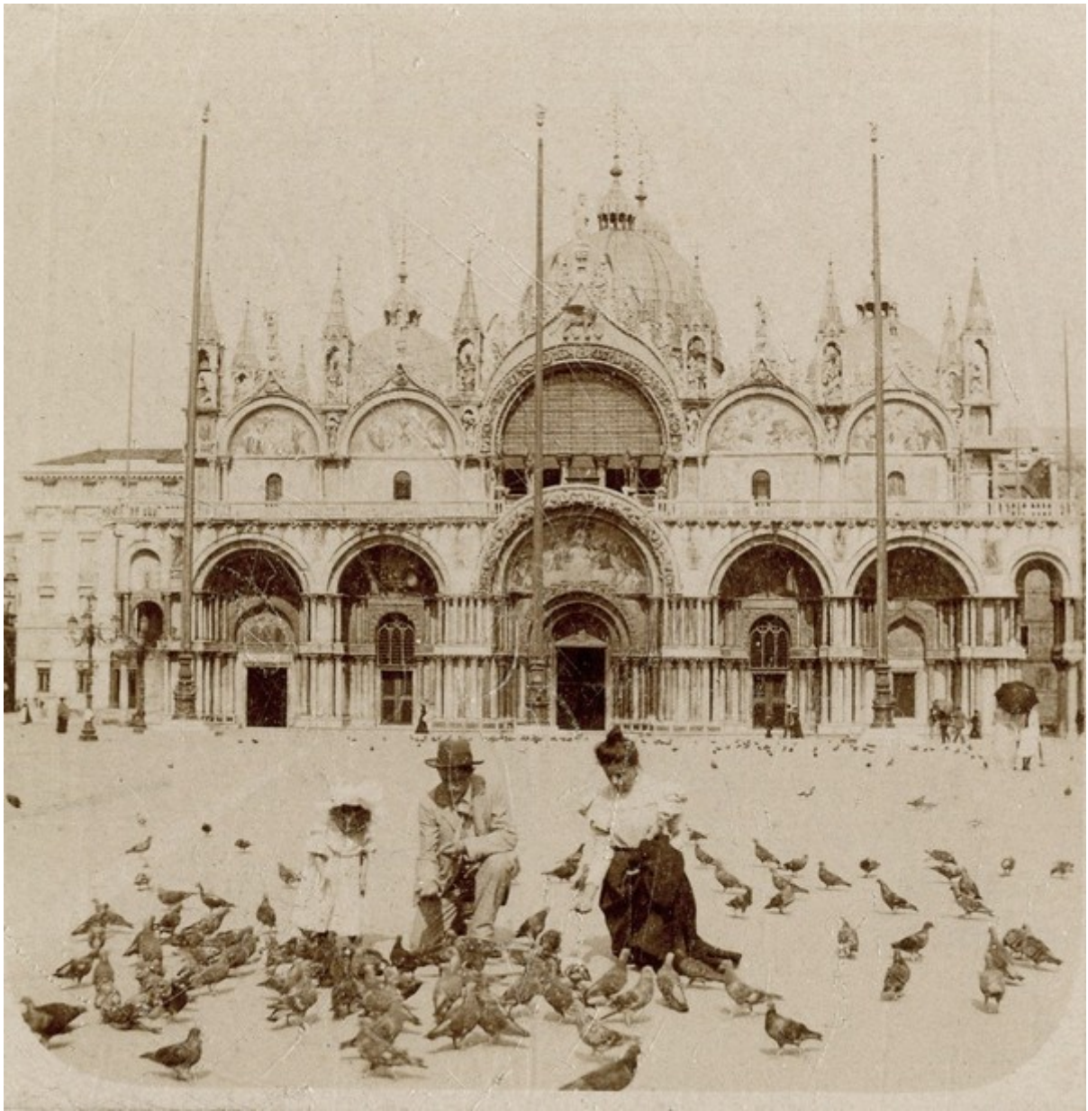
Венеція. Собор Святого Марка

Стереофото 1904, з колекції родини Грушевських