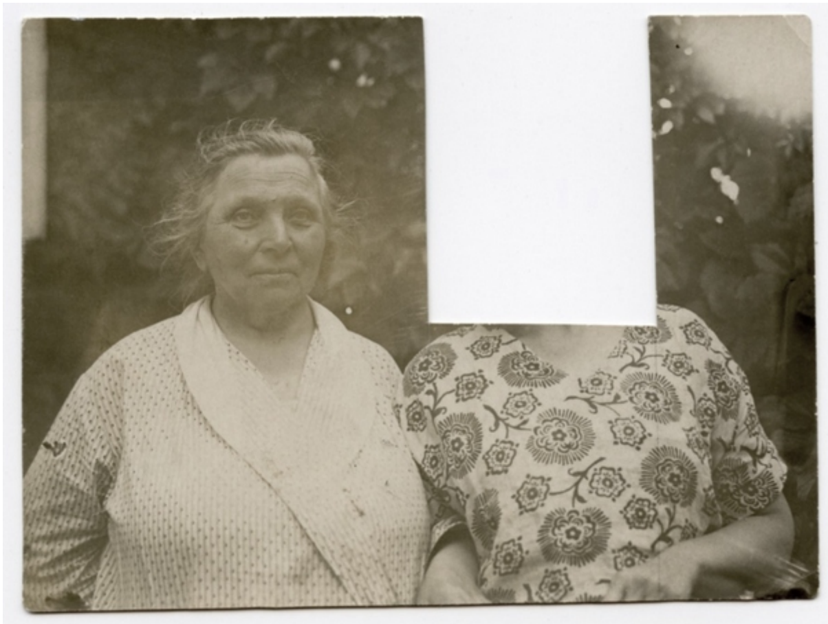
У такому вигляді дійшла до наших днів остання світлина Матері з Донькою