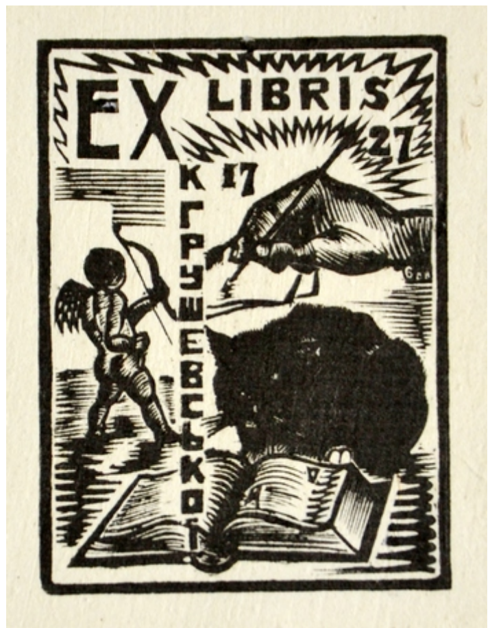
Екслібрис Катерини Грушевської Худ. Василь Стеценко. 1927

1931-го розпочалося "почесне заслання" Михайла Грушевського – вимушений від'їзд до Москви. Слідом, для "помочі академіку Грушевському", відряджена й Катерина.