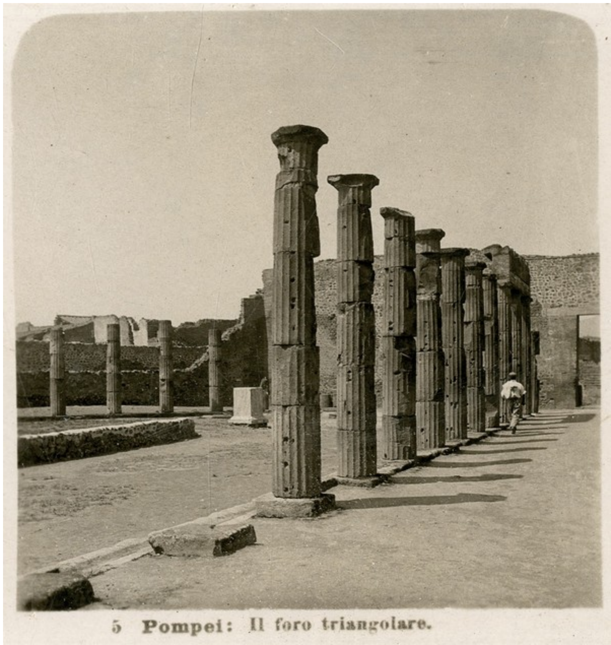
5 Pompei: Il foro triangolare.