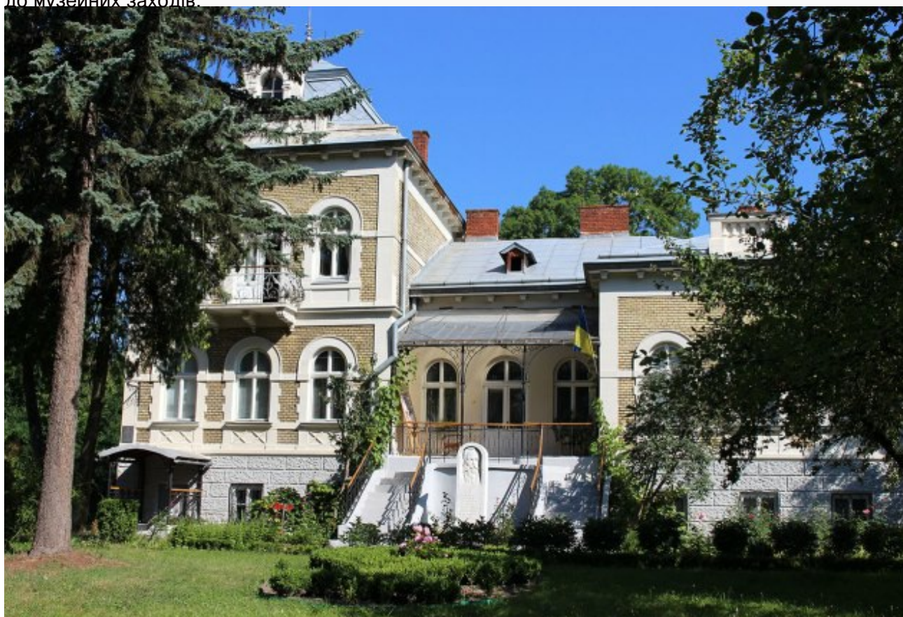
Державний меморіальний музей Михайла Грушевського у Львові

Отже, розумне впровадження та застосування новітніх технологій відкриває перед меморіальними музеями багато можливостей для покращення показників діяльності, а також підвищує увагу відвідувачів до музейних заходів.