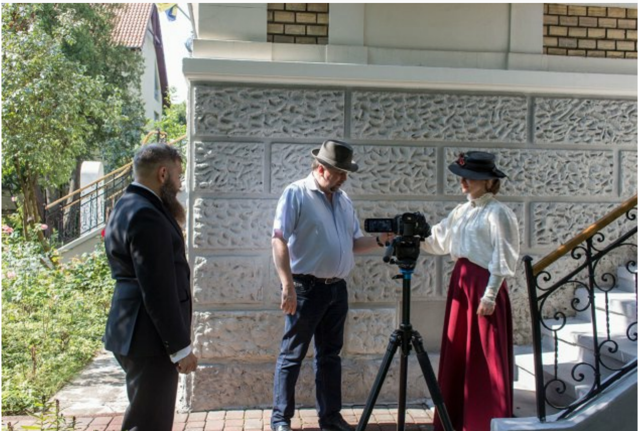
Робочі моменти на зйомках фільму "14 місьць Михайла Грушевського у Львові"