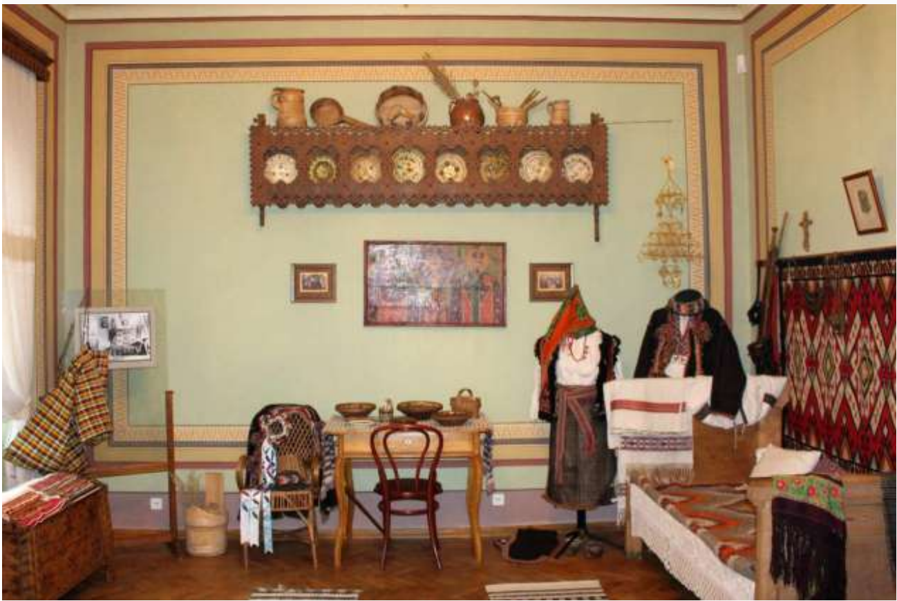
Кімната у гуцульському стилі в маєтку Грушевських. Фото 2015 року