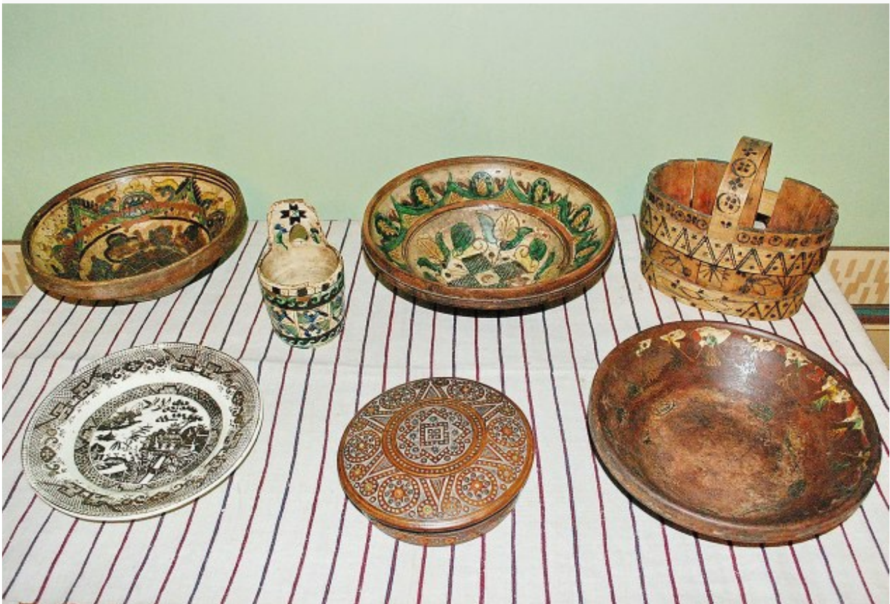
Фондова колекція Державного меморіального музею Михайла Грушевського у Львові