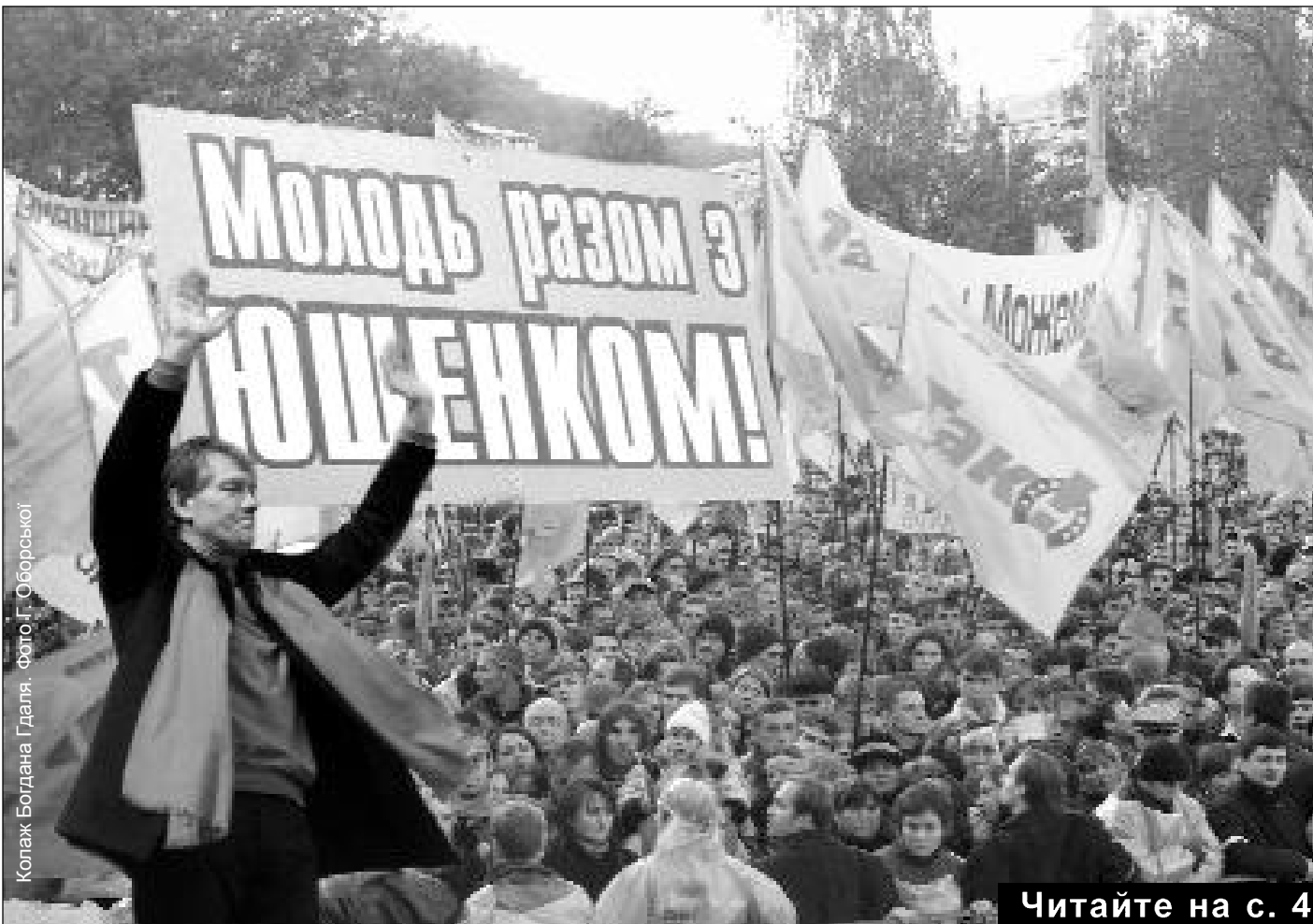
Коллаж Богдана Гдаля.

ТИЖНЕВИК ВСЕУКРАЇНСЬКОГО ТОВАРИСТВА «ПРОСВІТА» імені ТАРАСА ШЕВЧЕНКА