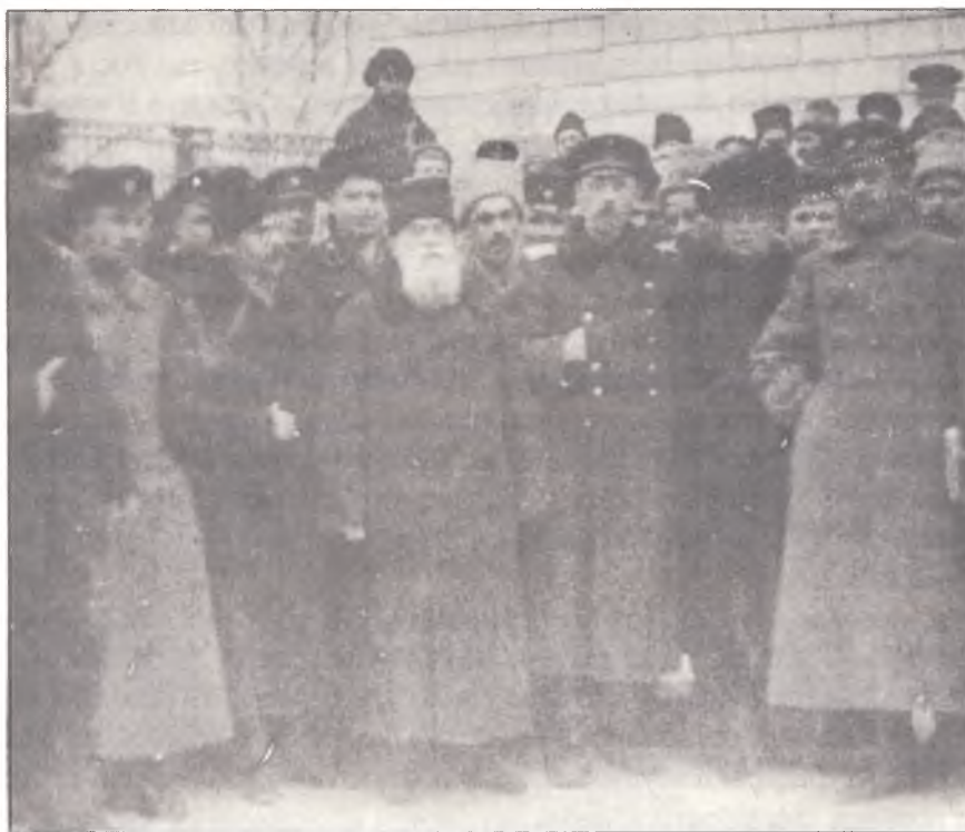
М.С.Грушевський серед делегатів 8-ї сесії Української Центральної Ради. Грудень 1917 р.