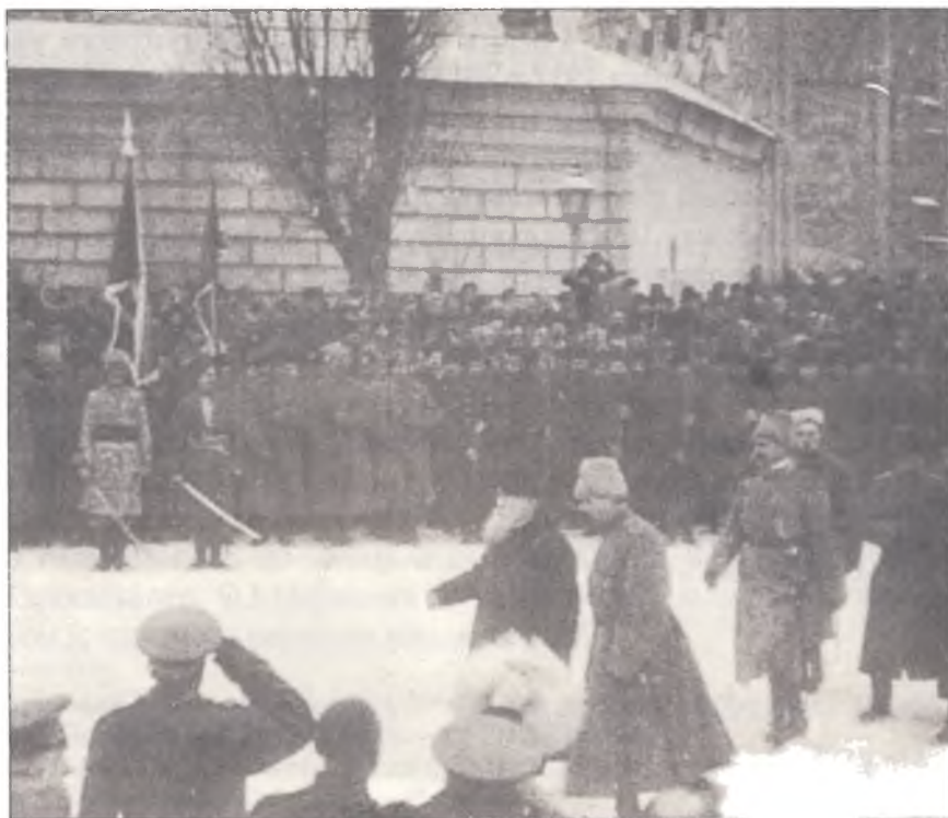
Парад частин Вільного козацтва. Київ, грудень 1917 р.