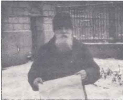
Голова Української Центральної Ради М.С.Грушевський. 1917 р.

є домагання демократичної республіки для України, се б то навіть Гетьманщини і цілковитої самостійності”, правда, з деяким застереженням – “коли се можливо”, а також зазначено, що УЦР має взяти на себе представництво всієї України 4 .