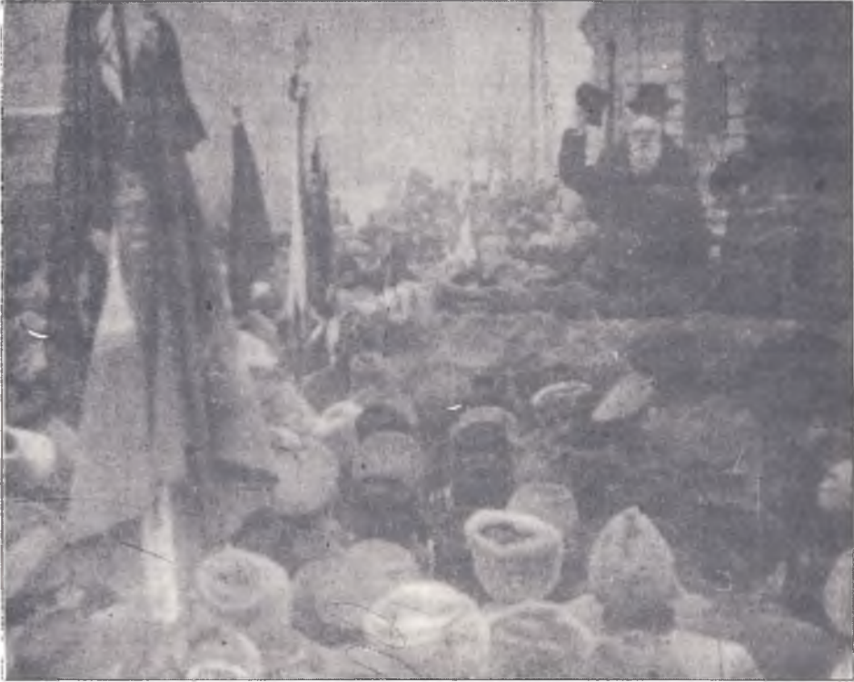
М.С.Грушевський виступає на мітингу в Києві. 1917 р.

життя. А саме: Конгрес, як повноважний орган національної волі, офіційно передав усю свою повновласність вибраному з себе органів: новій Центральній Раді. З цього моменту Центральна Рада ставала, дійсно, представницьким, законним (за законами революційного часу) органом усієї української демократії” 14 .