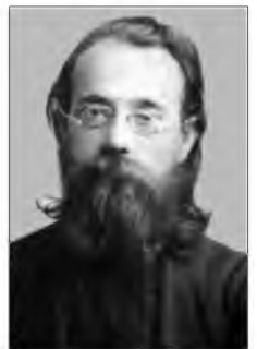
М. Ф. Грушевський.