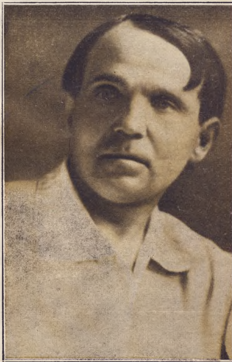
Заслужений артист республіки Гнат Юра