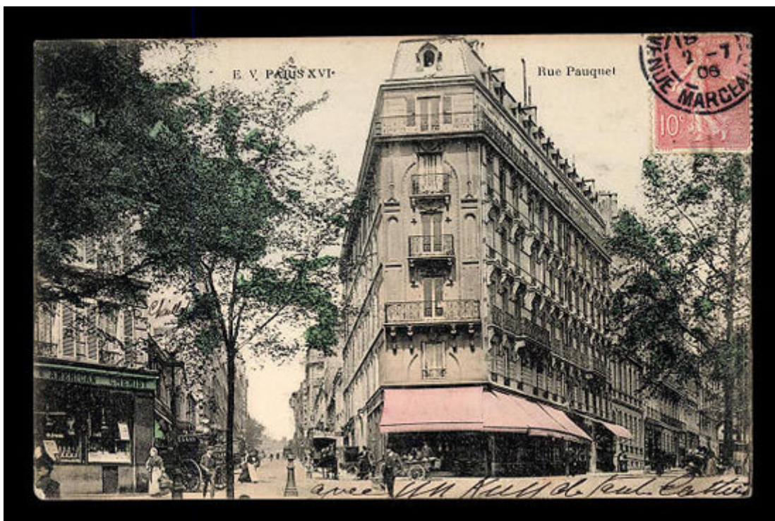
↑ Париж. Вулиця Pauquet

Ризикована від самого початку акція завершилась, на щастя, успішно. 23 (10) травня 1903 р. посылка надійшла до Львова, чим неабияк потішила вченого. Обов'язковість Ф.Вовка та добра робота пошти врятували важливу частку наукової спадщини видатного історика, яка й дотепер зберігає «аромат» Парижа в канцелярських папках із зав'язками у сховищах Центрального державного історичного архіву України у Києві.