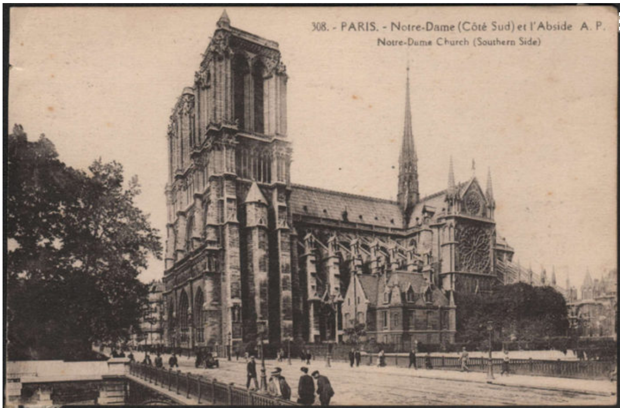
↗ Париж. Собор Паризької Божої Матері