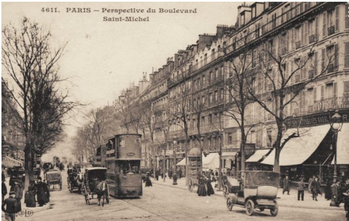
↗ Париж. Бульвар Сент-Мішель