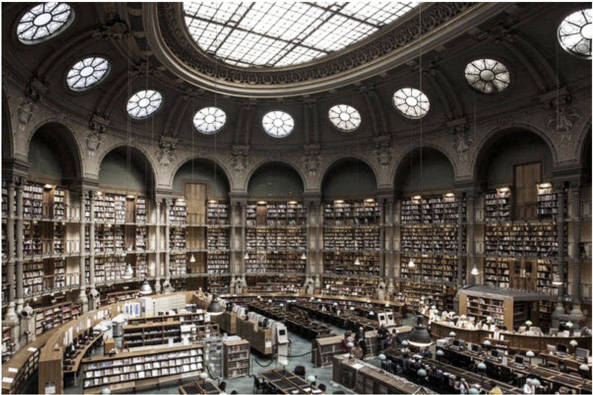
^ Національна бібліотека Франції. Овальна зала. Сучасний вигляд Джерело зображення: www.bnf.fr .

Шкода, що не залишив нам Грушевський есеїв про пам'ятки Парижа. Проте небагато потрібно фантазії, щоб уявити, як замилювався він збірками Лувру, затамовував подих перед найвизначнішою пам'яткою французької столиці — Notre-Dame de Paris, символом Франції — Ейфелевою Вежею, найбільшою аркою в Європі — Триумфальною, унікальним комплексом — Палацом Версаль. Ці адреси відомі кожному, навіть тим, хто лише мріє про Париж.