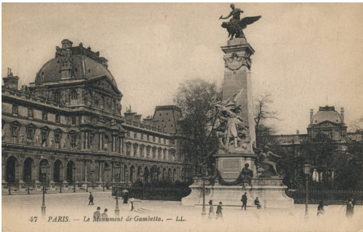
↗ Париж. Лувр

Два «свідки» перших наукових «гастролів» Михайла Грушевського до столиці Франції дожили до нашого часу, залишивши про себе таку історію. Готуючись до лекцій, вчений захопив з собою не лише видані томи «Історії України-Руси», але й автографи IV та V томів, що ще не вийшли у світ. Повертаючись