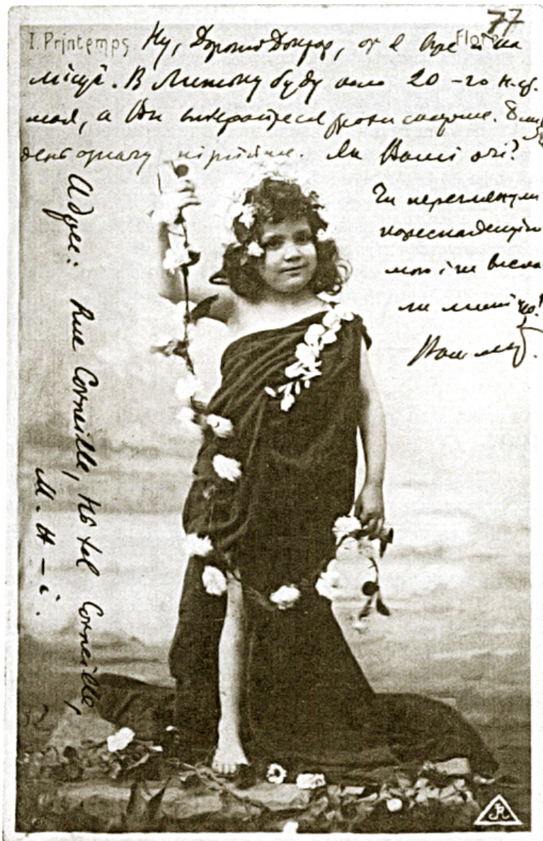
^ Лист на поштівці Михайла Грушевського до Івана Франка з адресою готелю Cornille [Париж. 21 квітня 1903 р.]